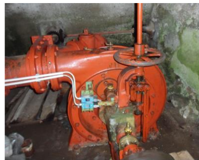
Unser Kraftpaket Die Turbine