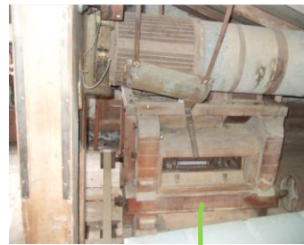
Getreidereinigung Der Trieur und die Windfege entfernen Samen und Fremdstoffe In der Schälmaschine werden die Getreidekörner geschält (kann leider nicht besichtigt werden)