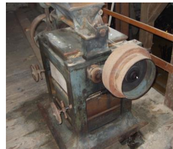
Im Walzenstuhl und im Mahlgang wird das Getreide gemahlen