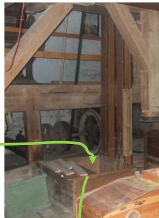
Ab in den Trichter