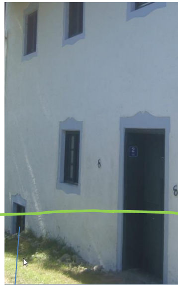
Hier geht's in die Mühle