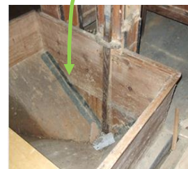
Mit dem Elevator geht's nach oben